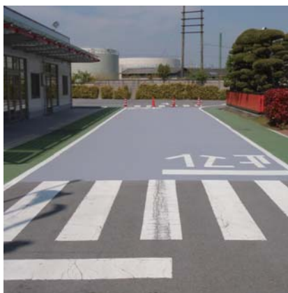
工場入り口歩道部