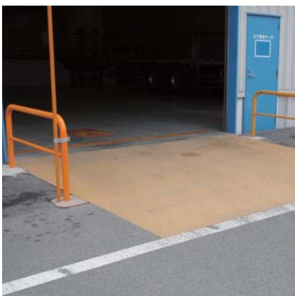
フォークリフト出入口