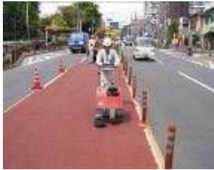
余剰タフバーン回収